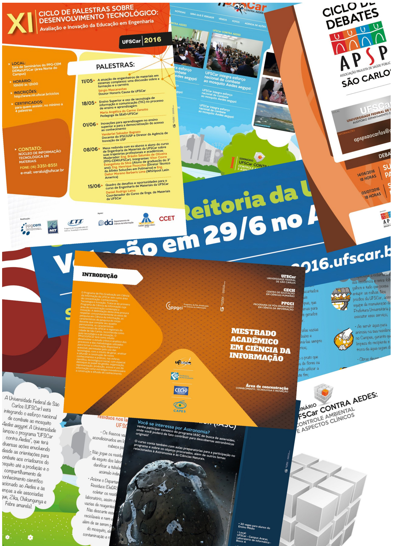
Mostra das peças gráficas elaboradas em 2016 (até o mês de agosto de 2016)