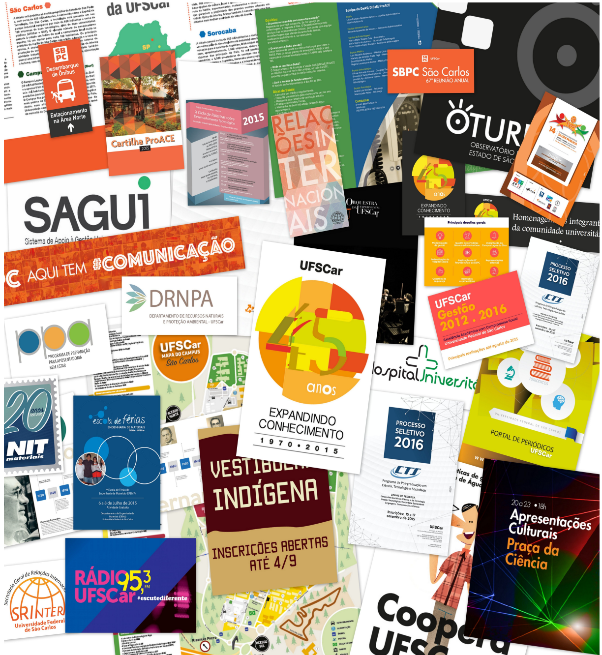
Figura 1: Produções gráficas da CCS (2015)